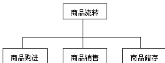
图 1-3 小商品流通企业会计核算内容